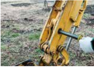
Tháo chốt bảo vệ