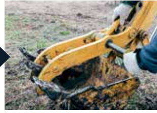
Lắp chốt cố định cánh tay