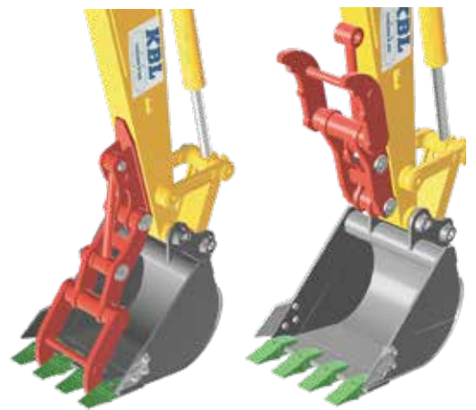
Loại tiếp xúc tấm đế