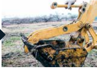
Hạ cang nâng EC