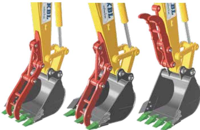
Loại tiếp xúc với móng gầu